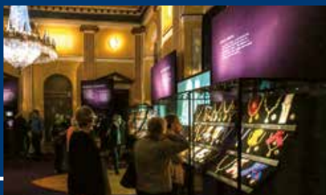
Årets veterankommune · side 5