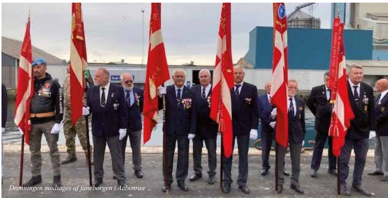
Dronningen modtages af faneborgene i Aabenraa