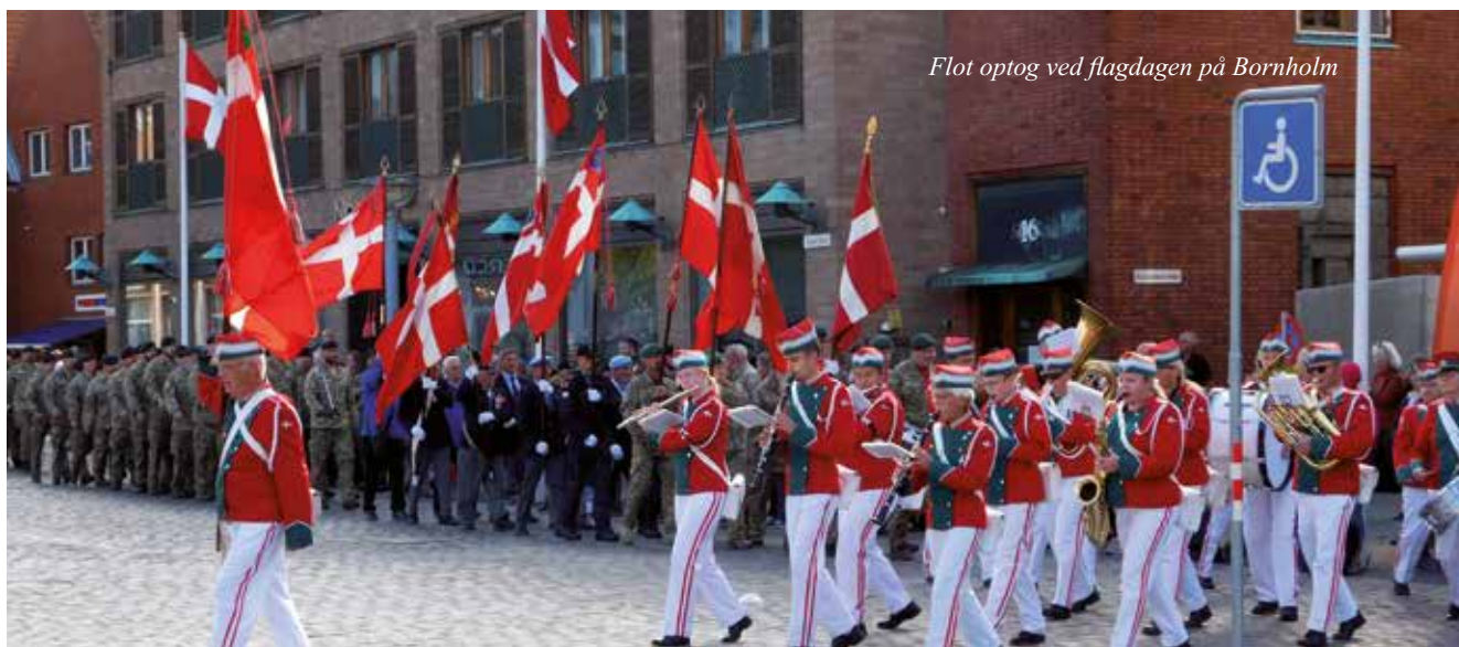
Flot optog ved flagdagen på Bornholm