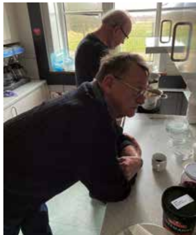
Der arbejdes i køkkenet