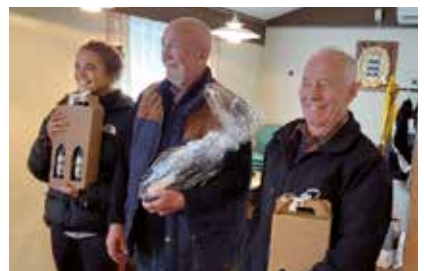
De 3 vinder fra hyggeskydningen er

Efter skydningen var der tændt for grillen, et godt tiltag fra skytterne, men vi vil selvfølgelig gerne se endnu flere brødre