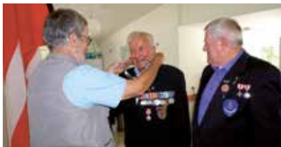
Afgående fuglekonge overrækker kæden til den nye fuglekonge.