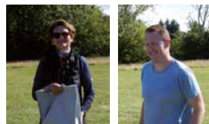
Vinderne damer og herrer

Efterfølgende deltog godt 100 personer i fællesspisningen af den medbragte mad, der blev nydt i det fantastiske vejr.