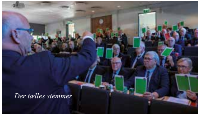
Der tælles stemmer

Vicepræsident Øst orienterede om, at skydemedaljeophæng skal være enkeltbånd fremover, da korsbånd er "ulovlige". Lageret med korsbånd bruges dog op først.