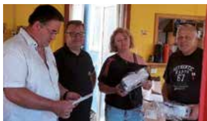
Stemmingsbillede fra præmieoverrækkelsen