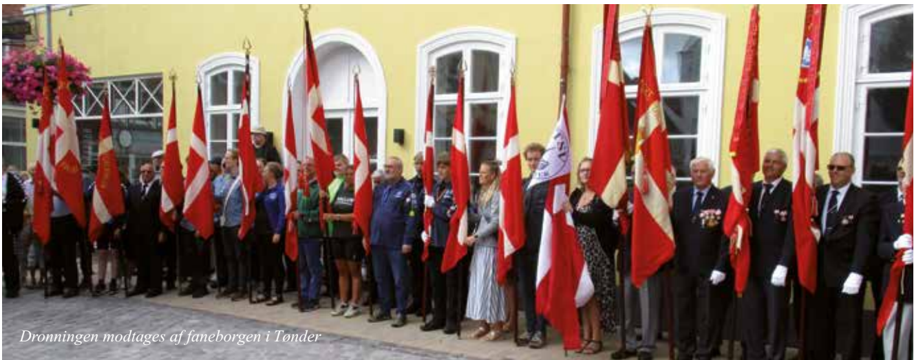
Dronningen modtages af faneborgen i Tønder

Oppe på torvet skulle vi stå bag ved den tribune, som Dronningen sad på. Efter en gymnastik opvisning kørte hun væk i en hestetrukken karet med gardehusarer som eskorte. En tur rundt i Tønder for at se på nogle udgravninger. Vi andre blev budt på rundstykker og kaffe i Sognehuset.