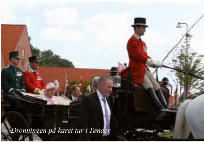
Dronningen på karet tur i Tønder

Sommeren går på hæld og vi kan se tilbage på en række begivenheder med flot deltagelse af Kredsens selskaber.