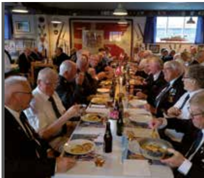
Godt samvær på tværs af civile og militære organisationer.

”Paradeførerhatten” blev anlagt, hvorefter han kommanderede faneoptøget i retstilling, gav orientering om afrigning og efterfølgende spisning i Marinestuen, og slutteligt ”Trød af”.