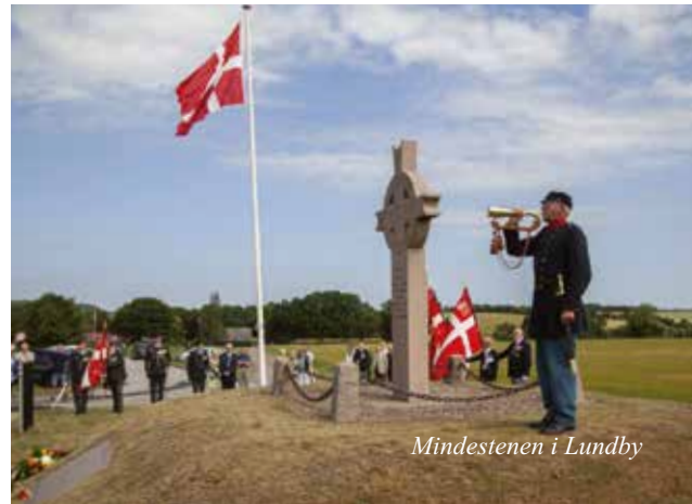
Mindestenen i Lundby

Aalborg-selskabet havde renoveret en mindeplade, og derefter ansøgt om økonomisk støtte fra en fond under DFB. Debat om ansøgningsreglerne. LBM principbesluttede at give støtte til mindepladen, dog med anmodning om en udvidet dokumentation om andre ansøgninger forinden. Støtten gives med kontantkassebeløb fra "Brevmærke- og telegramfonden".