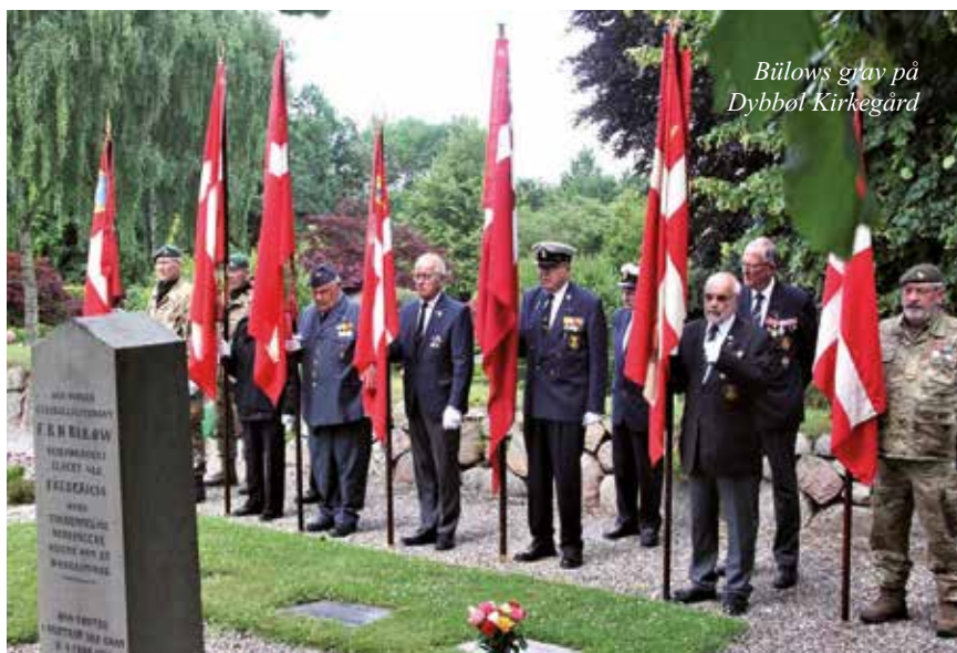
Bülow's grav på Dybbøl Kirkegård

25. Juli var der mindesammenkomst ved RAF stenen på Arnkilmaj, der blev lagt buketter fra Kontaktudvalget, Kommunen og Folk og Sikkerhed. Der var deltagelse af 8 flag/fane kommandoer sammen med vores fane og ca. 25 civile tilskuere.