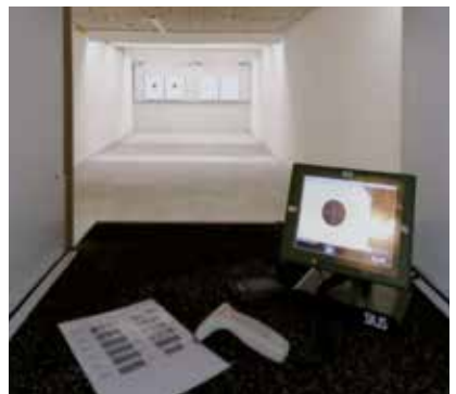
Standplads på skydebanen.