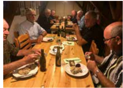
Skipperlabskovs med tilbehør

Klubaftener startede igen torsdag den 22. september, hvor der blev serveret skipperlabskovs med tilbehør. Efterfølgende var der kortspil. Er der brødre der ønsker at spille kort, kan der tages kontakt til bestyrelsen.