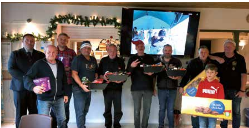
Fra Juleskydningen 2021 Vinderne har modtaget gevinster.