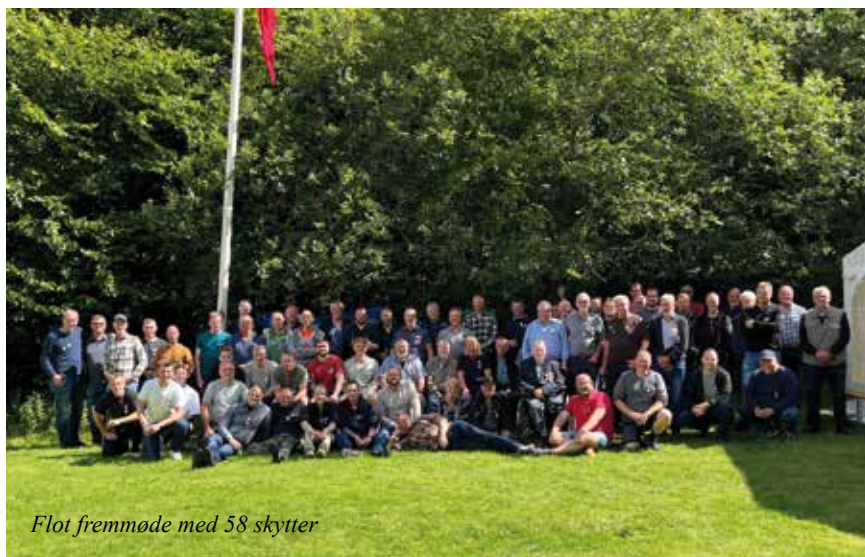
Flot fremmøde med 58 skytter

Kl. 10.10 og med 58 skytter startede kongen med det første skud på årets fugl og allerede efter 8 min falder første plade H.slagfjer, hvorefter det går hurtigt med de næste 9 plader som alle er nede inden for 1½ time. Vi holder derfor tidlig og lang middag, hvor vi igen i år blev beværtet med hel stegt pattegris samt tilbehør.