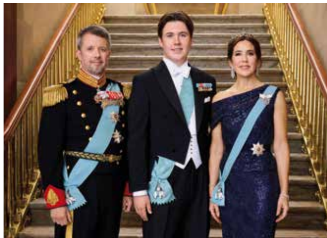
Det officielle portræt af Kronprinsparret og fødselsdagsbarnet

Det er ikke alle beskåret at få en Elefantorden på sin 18 års fødselsdag. Det er den ældste og fornemste af alle kongelige ordner, som H.M. Dronning Margrethe tildelte sit barnebarn på hans fødselsdag.