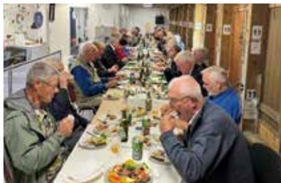
Frokost på skydebanen

riffel og luftgevær til cirkelskive. Desuden var der ringspil og luftgevær til hængende mål. Alt i alt havde vi en herlig dag på skydebanen. Inden vi kunne komme til præmieoverrækkelsen, skulle der også indtages lidt mad og drikke ved et langbord.