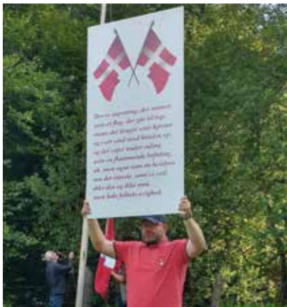
Sangbogen var til at få øje på

Kongen var vært ved en forfriskning inden turen fortsatte til engen, hvor vores „piger“ var klar med rundstykker samt kaffe, og vores formand bød alle velkommen efter at vi havde sunget, Der er ingenting, der maner.