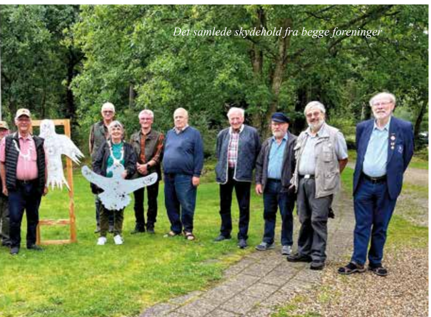
Der samlede skydehold fra begge foreninger