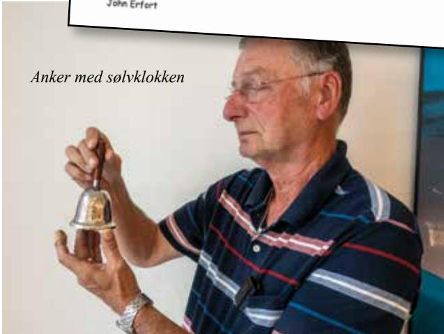
Anker med sølvklokken