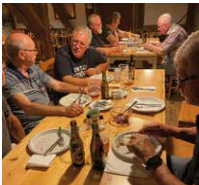
Brødrene spiser skipperlabskovs

Klubaftener startede igen torsdag den 21. september hvor der traditionen tro blev serveret skipperlabskovs. Efterfølgende var der kortspil. Er der brødre, der ønsker at spille kort, kan der tages kontakt til bestyrelsen.