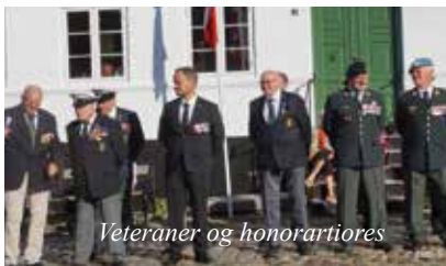
Veteraner og honorartiores

Han opfordrede tilhørerne til at overvære orkesterets to-tre musiknumre på Torvet, og ønskede derefter alle god tur hjem.