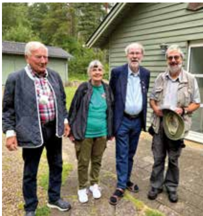
Holdet fra DFB

Bestyrelsesmøder. Næste bestyrelsesmøde afholdes i Paradiset den 7. december klokken 18.30.