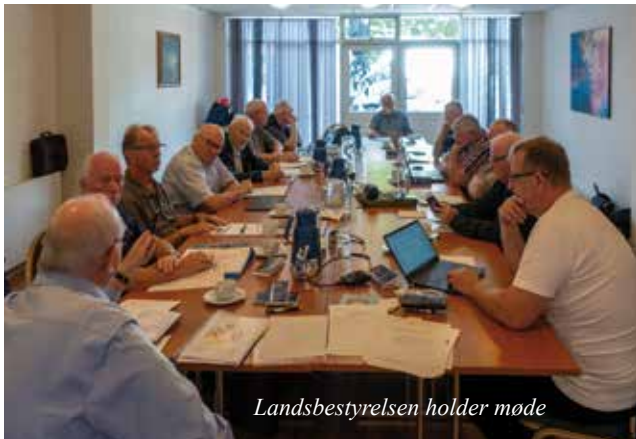
Landsbestyrelsen holder møde

Jeg havde den ære at repræsentere jer for første gang som kredsformand ved Landsbestyrelsesmødet fredag den 15. september i Fredericia.