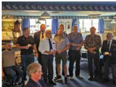
Bedste holdskytter deltagende hold-2