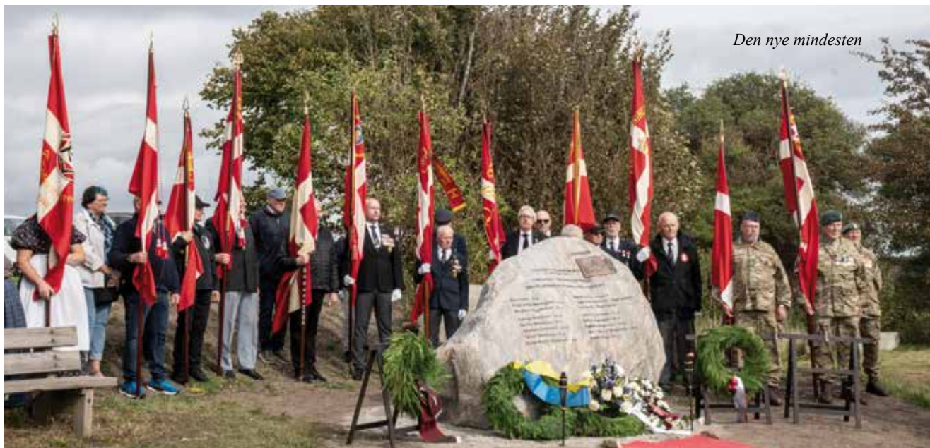
Den nye mindesten

I anledning af 80-året for de danske jøders flugt blev der rejst en særlig mindesten på Stevns. Kreds 3 var repræsenteret ved 3 faner, Karise-Spjellerup, Kongsted og Vordingborg