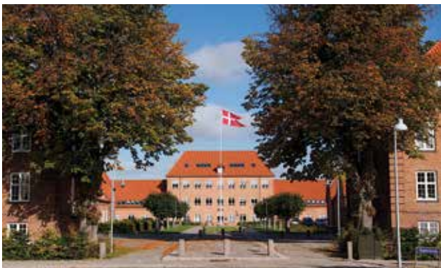
Veterancentret holder til på Ringsteds gamle kaserne

Veterancentret, der har hjemsted i Ringsted, var som sædvanligt med fra morgenstunden. Efter at Dannebrog var gået til tops gik alle med musik og faner i front til arrangementet i Ringsted Kongrescenter.