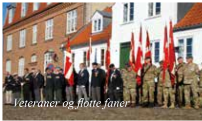
Veteraner og flotte faner

Danmarks nationalsang blev sunget som sidste fællessang, hvorefter vores formand takkede alle fremmødte og rettede en tak for økonomisk støtte til Syddjurs Kommune, og til Museumsforeningen for lån af pladsen foran rådhuset.