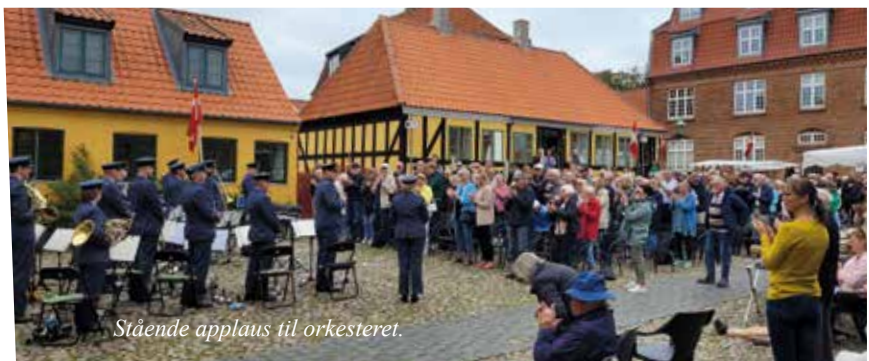
Stående applaus til orkesteret.

det muliges kunst kommer igen til næste år. Orkesteret og arrangementets hjælpere nød efterfølgende en dejlig anretning i Marinestuen.