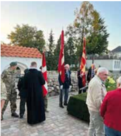
05.09.2023 19:45 Afsløring samt mindehøjtidelighed med fanen.