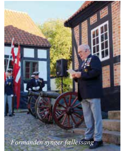
Formanden synger fællessang

og Omegn havde planlagt og afviklede dette arrangement til ære for vores udsendte og veteraner, og han takkede faner og flag, orkester, samt personel, slupkor og gæster for deres fremmøde og engagement på dagen. Ligeledes kunne han konstatere, at der blev flaget fra flere officielle og private flagstænger, ligesom arrangørerne havde opstillet en flagallé gennem byen.