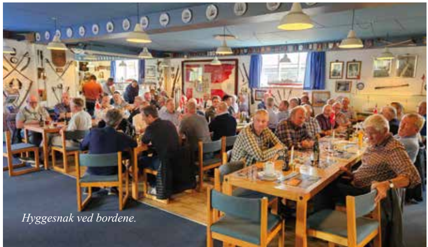
Hyggesnak ved bordene.

Vores formand deltog som nyvalgt kredsformand i 8. Kreds også i det om fredagen afviklede Landsbestyrelsesmøde.