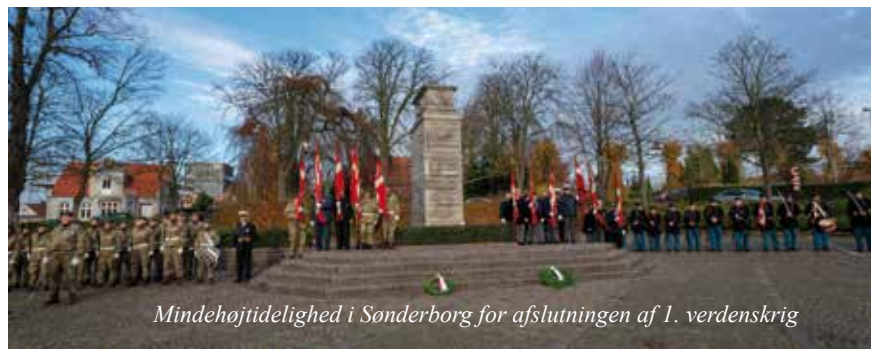
Mindehøjtidelighed i Sønderborg for afslutningen af 1. verdenskrig

Den 18 august deltog vi et mindearrangement i Holm på Nordals.