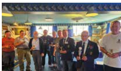
De tre vindende hold.

Flere af vores forenings deltagere kunne efter skydningernes afslutning være stolte af deres resultater, og formanden kunne sige STORT TILLYKKE til hold 1, som igen i år havde hjemtaget en flot og ærefuld 2. plads i holdskydningen med i alt 425 points ud af 450 mulige. Ebeltoft Marineforening tog sig ubeskedit af 1. og 3. pladsen – også tillykke til dem.