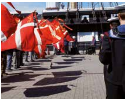
Hilsen under kransenedlæggelsen