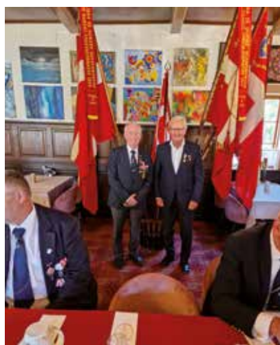
Finn og Find - to stolte brødre der begge modtog Forsvarsbrødrenes Fortjenstmedalje

Læs mere i referatet fra generalforsamlingen under 3. Kreds.