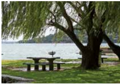
Den smukke Sorø Sø