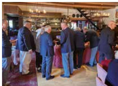
Dagen sluttede med kroens gode frokostbuffet.

Kredsformanden, havde afsendt et festtelegram til vores protektor, Hendes Majestæt, Dronning Margrethe II, hvori han meddelte majestæten, at 3. Kreds var forsamlet på Udby Kro til kredsmøde, og at vi fremsendte vores hilsen til majestæten. Senere på dagen, modtog Kredsformanden et telegram fra hoffet, hvori majestæten takkede for kredsens hilsen.