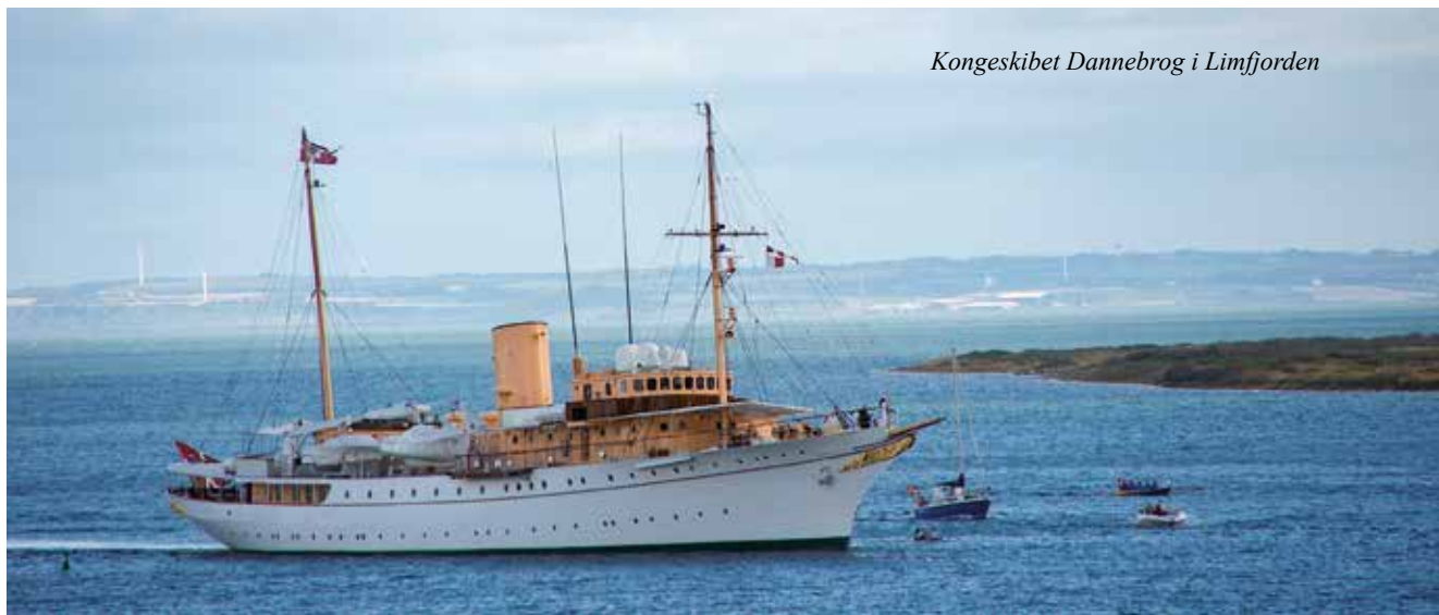
Kongeskibet Dannebrog i Limfjorden

Forhåbentlig kan de tre byer, Vordingborg, Randers og Fredericia se frem til besøg af H.M. Dronning Margrethe i sensommeren