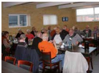
Kaffebordet efter turneringen er afsluttet.

Næste bowlingturnering er programsat til torsdag den 19. oktober. Mere herom i selskabets lille blad, der udkommer efter sommerferien.