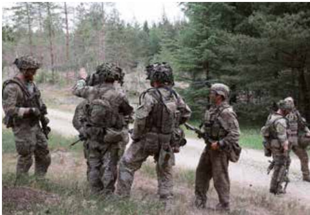
Soldater fra II Panserinfanteribataljon/JDR rekognoscerer for et egnet sted til beredskabsområde. Kampbataljonen udgør kernen af den styrke som 1. Brigade uddanner til NRI-beredskabet.

1. Brigade er Hærens største landmilitære kapacitet og bidragsyder til NATOs kollektive forsvar. I 2023 opstiller og uddanner 1. Brigade en bataljon med støtteenheder, der i 2024 skal stå i beredskab i NATO Readiness Initiative (NRI). I 2022 blev NRI-beredskabet aktiveret pga. Ruslands invasion af Ukraine og aggressive adfærd. Det førte til, at en kampbataljon opstillet og uddannet af 1. Brigade var udsendt til Letland i 2022-23. Formålet var at afskrække Rusland fra at angribe NATO-lande.