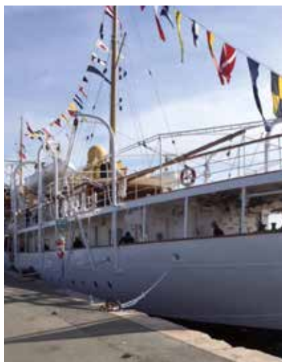
Det Norske kongeskib