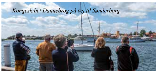
Kongeskibet Dannebrog på vej til Sønderborg

Disse sommertogter tager udgangspunkt i en tradition, som går hele vejen tilbage til Christian X, der dengang rejste rundt i de danske farvande.