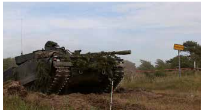
Panserinfanteri med infanterikampkøretøj rykker frem over udgangslinien.

Panserbataljon, har på øvelsen haft som mål at styrke det indbyrdes samarbejde mellem de enheder, der sammen skal stå i beredskab i 2024.