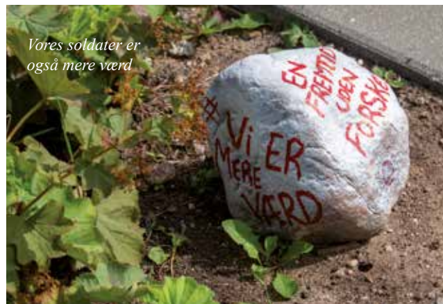
Vores soldater er også mere værd

Jeg hverken kan eller vil søge at prioritere, hvad Forsvaret mangler af materiel, men det er sikkert, der mangler personel. Men hvad skal der til, for at igen gøre det attraktivt at være soldat. Nuvel beskæftigelsessituationen i samfundet spiller en vis rolle, men det er klart at løn og ansættelsesform også spiller en væsentlig rolle. Gennem længere tid og særligt op til Folketingsvalget var emner som velfærd og sikkerhed ord som vi ofte hørte fra politikernes mund. Velfærds job som kunne sikre "bløde værdier" og sikkerhed i form af et troværdigt forsvar, særligt efter russernes invasion af Ukraine. Men jeg tror, at vi godt kan være enige om, at uden den ydre sikkerhed i form af soldater eks. vis i Baltikum og politiet der er garant for den indre sikkerhed - ingen velfærd.