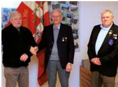
Formanden samt aftenens tilstedeværende modtagere af hæderstegn.

På grund af kassererens sygdom kunne tegnene ikke udleveres på stedet.