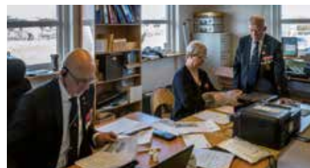
Resultaterne samles, - her i Næstved

Gamle mestre skulle forsvare deres titler og heldigvis var der en hel del unge udfordrer. Resultaterne kan ses her, og et stort tillykke til vindere. Du kan se alle resultaterne på vores hjemmeside.