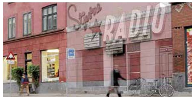
Den genskabte facadetegning kopieret ind på billedet af muren