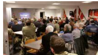
Et blik ud over forsamlingen til foredraget

Aftenen sluttede med kaffe og blødt brød. Aftenen må betegnes som vellykket, og et tilsvarende samarbejde vil blive fulgt op på et senere tidspunkt, blandt andet med bowlingturnering i april.