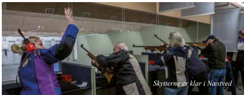
Skytterne er klar i Næstved

Gamle mestre skulle forsvare deres titler og heldigvis var der en hel del unge udfordrer. Resultaterne kan ses her, og et stort tillykke til vindere. Du kan se alle resultaterne på vores hjemmeside.