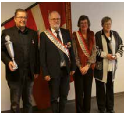
Fugledronning og fuglekonge samt skyttdronning og skytekonge.

Der blev i alt afgivet 726 skud på fuglene. Der deltog samlet 20 skytter, der hyggede sig både på skydebanen, men også ved den efterfølgende spisning og præmieuddeling.