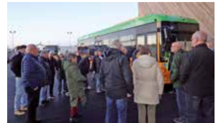
Her får vi en grundig gennemgang af bussens funktioner.

Og hvor langt kan så køre? Det kommer an på vind, vej, frost, terræn og så videre. Dertil hvor meget man bruger speederen – bussen lader nemlig selv op når foden lettes – og ellers lys, varme og alt der bruger el.