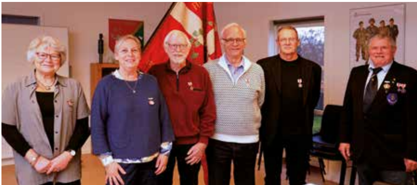
Formanden samt aftenens modtagere af hæderstegn og broderbrev.