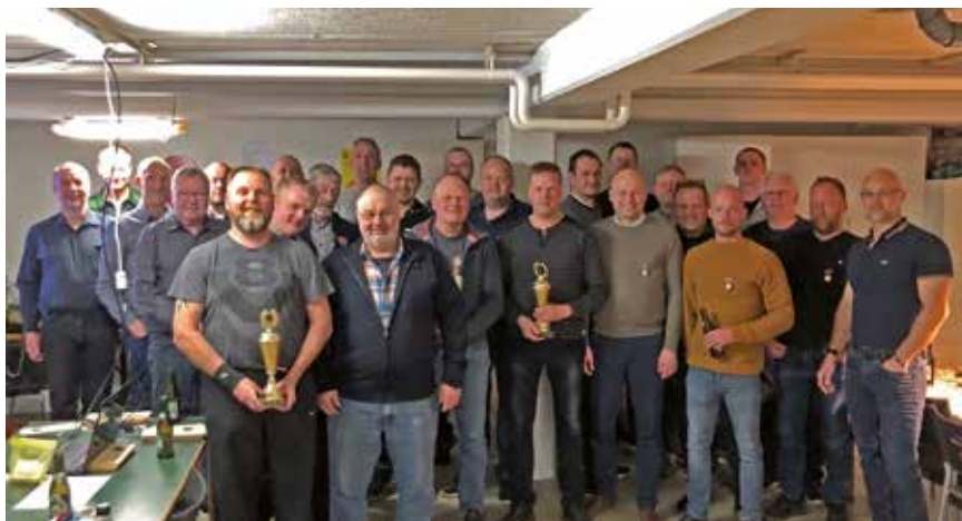
Flot fremmøde til vinterskydningen