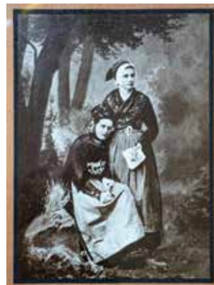
Fotografiet af Schumann

Det var den flensborgske fotograf Schumann der tog billedet af de to piger. Helga, som var den yngste, var siddende i en dragt fra øen Föhr og den ældre, Valborg, stående i en alsinger dragt.