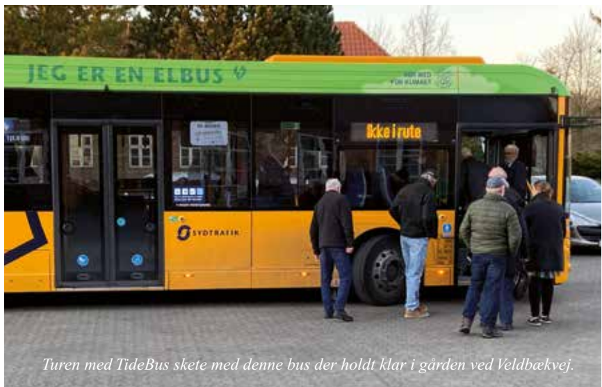
Turen med TideBus skete med denne bus der holdt klar i gården ved Veldbækvej.

Efter rundvisningen gik turen retur til Veldbæk, hvor et veldækket ”nytårsparole bord” hurtigt blev etableret og ændret til et ”forårsbord” og det er så her den stegte sild kom på bordet sammen med andre herligheder, som fandtes i rigelige mængder. Mon ikke der er til et par bestyrelsesmøder og en generalforsamling i overskud, hvis man da kan gemme maden så længe?