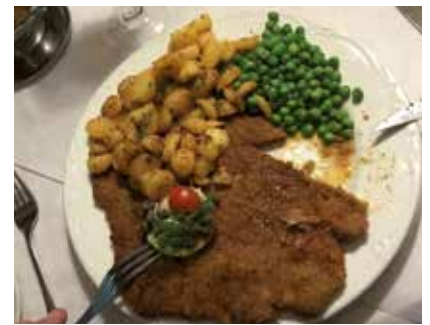
Der var snitsler til de kræse!!

glade brødre med vedhæng deltog, og jeg tror til stor tilfredshed for alle.