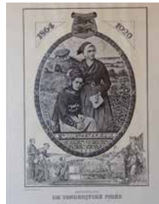
Litografien, kunstner ukendt

Selv efter megen søgning på nettet er det ikke lykkedes mig at finde kunstneren der er mester for den flotte litiografi. En litografi bliver tegnet spellendt på en sten, den bliver så brugt til at trykke et ark ad gangen, så der er ikke 2 af trykkene der er 100% ens.