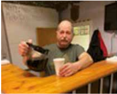
Kaffe fra Formanden

merne ”til en snak og en kop kaffe” som formanden skrev.