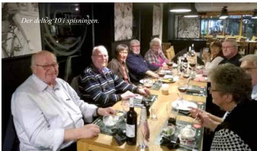
Der deltog 10 i spisningen.