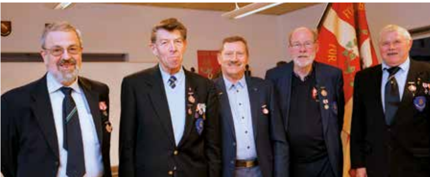
Tilstedeværende bestyrelsesmedlemmer og dirigent.