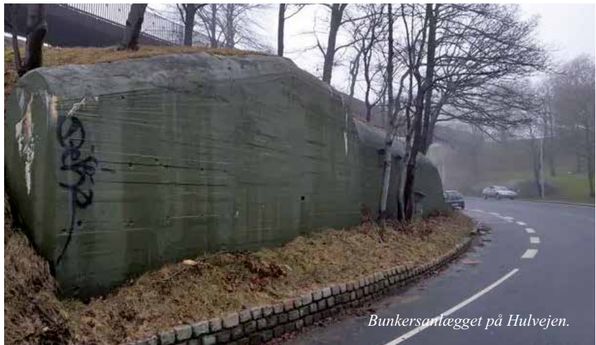
Bunkersanlægget på Hulvejen.