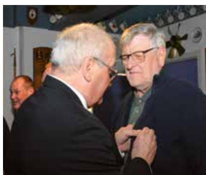
Bare stik igennem, formand