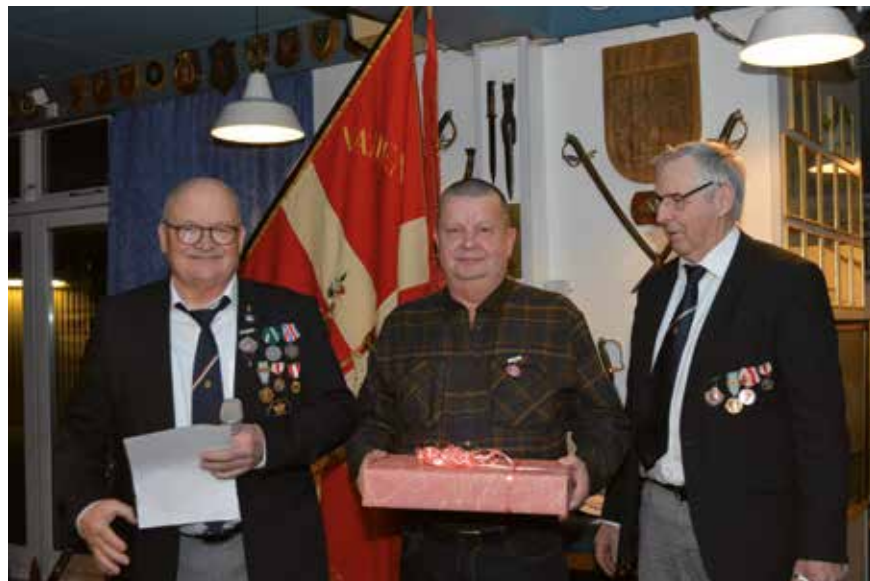
Årets fuglekonge med præmie