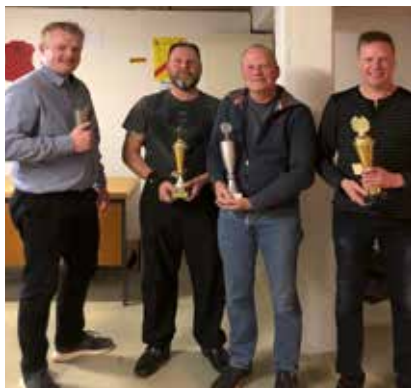
Vinderne af vinterskydningen

Vores andet arrangement var Lørdag den 12. marts hvor vi igen var samlet på skydebanerne under Skovvangsskolen, ca. 30 skytter var mødt op til den årlige vinterskydning, vi hyggede os fra vi mødtes til vi forlod lokalerne kl.15.30 og Ind imellem skydningerne blev det sociale fællesskab dyrket så helt igennem en fin dag som vi kun kan anbefale at man møder frem til næste år.