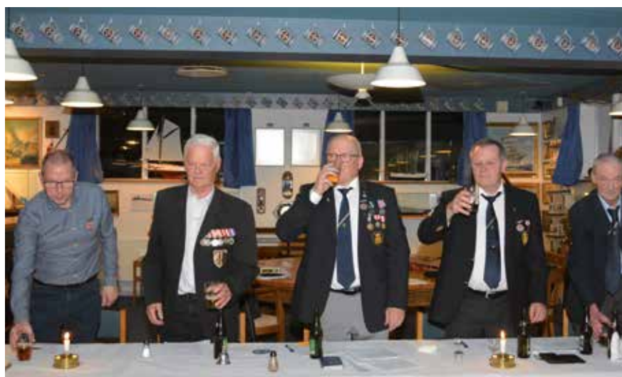
Nye medlemmer i foreningen med næstformanden. th.

Formanden tog herefter bestik af situationen med krigen i Europa og Ruslands uprovokerede aggressioner mod Ukraine,