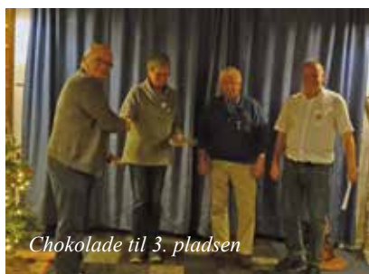
Chokolade til 3. pladsen