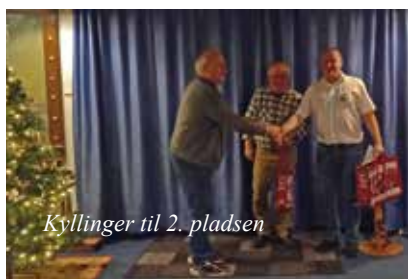
Kyllinger til 2. pladsen