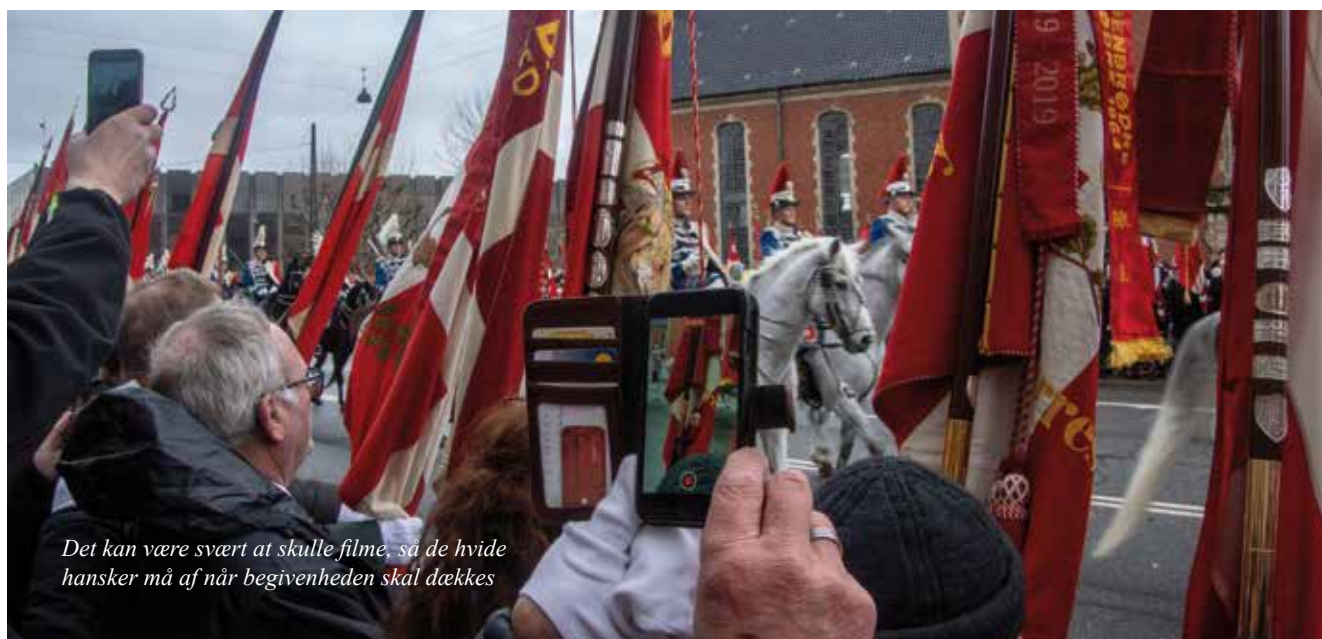
Det kan være svært at skulle filme, så de hvide hanser må af når begivenheden skal dækkes