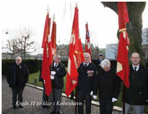
Kreds 11 er klar i København