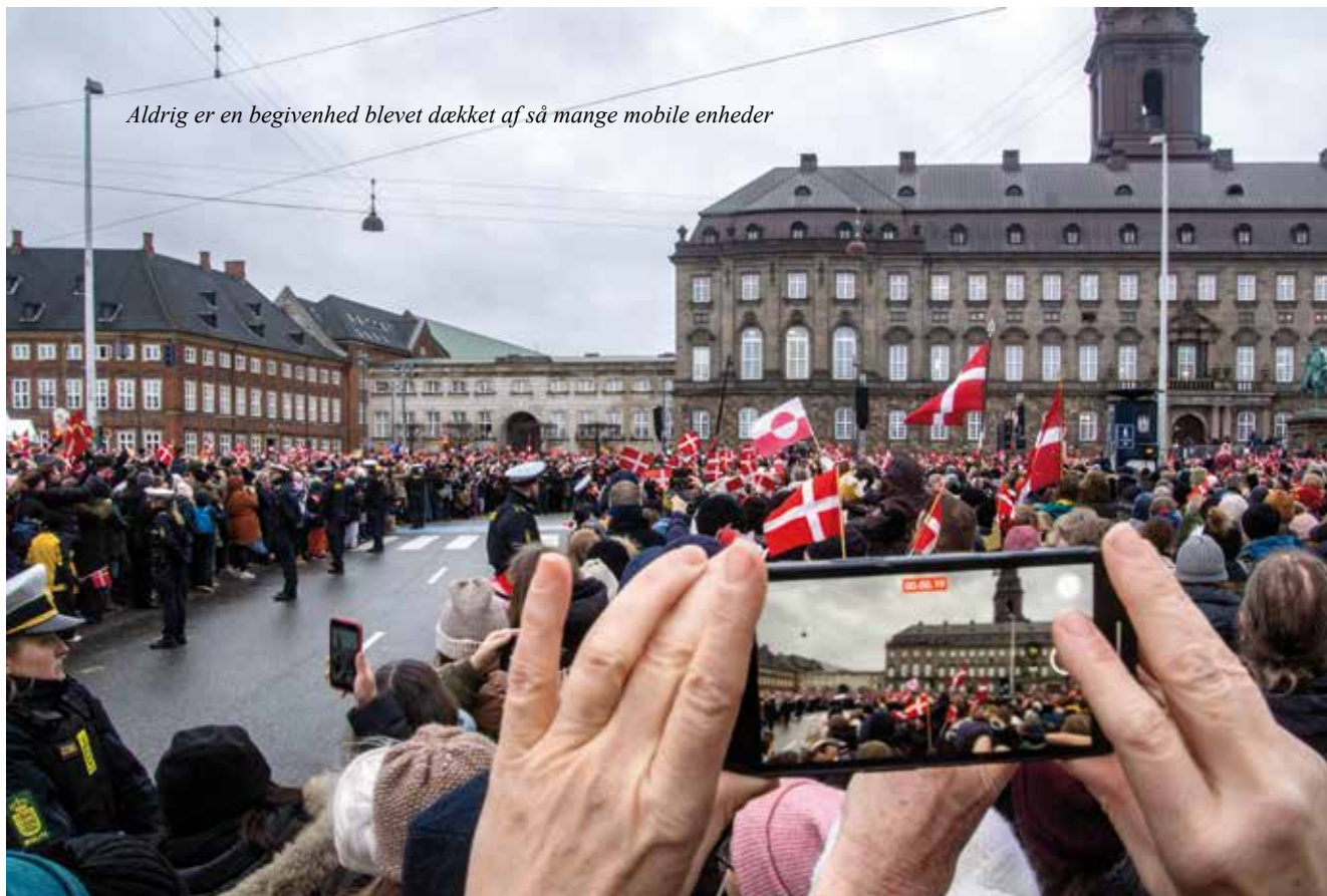
Aldrig er en begivenhed blevet dækket af så mange mobile enheder

Kun 14 dage efter Dronningens sidste nytårstale, var på samme dag, Dronningens og Kongens København, fyldt af glade og forventningsfyldte danskere