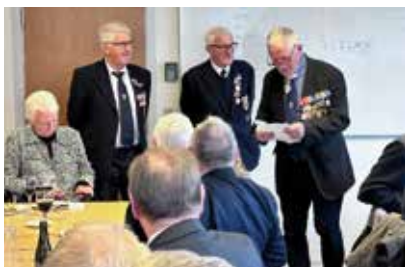
Billeder fra dagen.