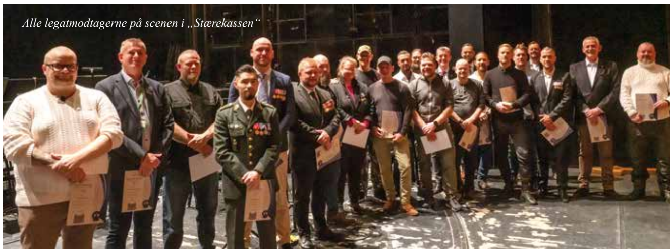
Alle legatmodtagerne på scenen i „Størekassen“