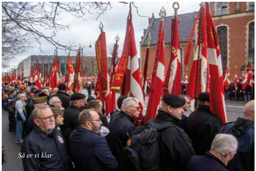
Så er vi klar

Vi vil fra selskabet, ligesom fra mange andre selskaber over hele landet, sende et fanebidrag til den planlagte faneborg ved Holmens Kirke i København, under tronskiftet den 14. januar. Vi glæder os til at byde vores nye regentpar, Deres majestæter Kong Frederik 10. og Dronning Mary, hjerteligt tillykke med tronovertagelsen. Når denne for vores land, så lykkelige