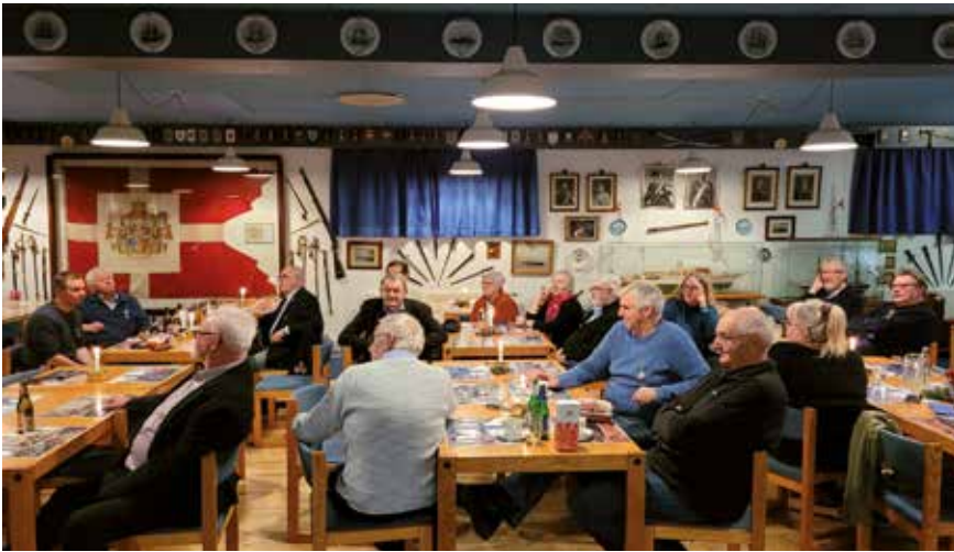
Afslappet stemning og julehygge.

Kl. 19 blev i begge foreninger foretaget lodtrækning til makkerhold, hvorefter skydningerne gik i gang – traditionen tro med 5 prøveskud og derefter 15 gældende.