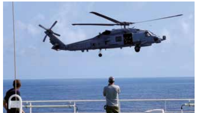
Fregatten ESBERN SNARES helikopter på 'fly past' ved ARK DANIA.

Det var fordi Danmark også her gik forrest. ABSALON var ikke bare til stede som så mange andre flådefartøjer, nej, ABSALON gik i gang og bekæmpede piraterne, med magt -som nødvendigt var.