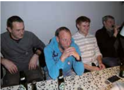
Stemmingsbilleder fra julefjældningen