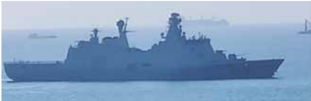
Fregatten ESBERN SNARE i Guineabugten november 2021.

Som beskrevet tidligere her i Forsvarsbroderen er den danske Fregat ESBERN SNARES udsendelse sammenfaldende med vores togt til Guineabugten. Indsættelsen af fregatten har til formål at bidrage til reducere af pirataktiviteten i Guineabugten.