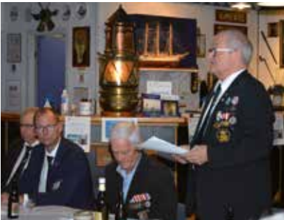
Beretning ved formanden.

Formanden orienterede om, at generalforsamlingen 2021 også inkluderede generalforsamlingen 2020, hvilket især gav sig udslag med to summariske beretninger, der dækkede de ”normale” perioder, hvilket betød, at perioden fra marts i år og frem til denne generalforsamling ikke var med. Dette begrundet i, at der skal være generalforsamling i marts 2022, hvor en ny beretning aflægges. Sluttelig vil der også, jf. dagsorden, blive afholdt til valg til tillidsposterne.