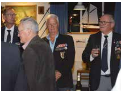
Formanden udbragte til slut et 3-foldigt LEVE og en skål for Vaabenbrødreforeningen.

Forsamlingen udbragte et trefoldigt leve for foreningen, hvorefter man begav sig hjemover.