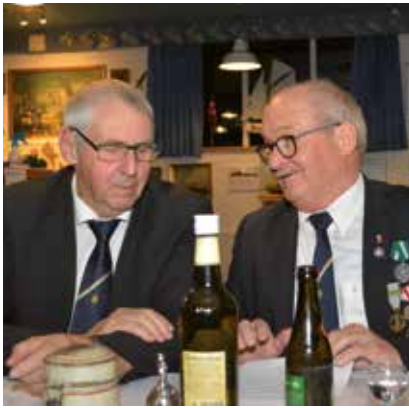
Formand og næstformand har strategien klar.