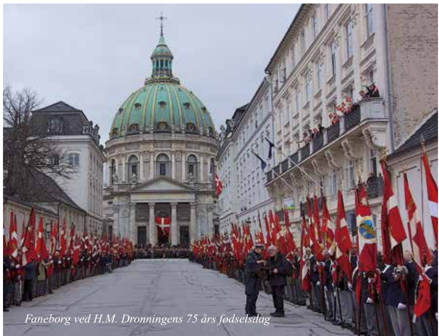
Faneborg ved H.M. Dronningens 75 års fødselsdag