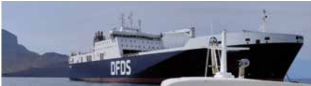
MV ARK DANIA ved Kap Verde.

Jeg håber I er kommet vel ind i det nye år. Jeg holdt nytåret herhjemme selv om jeg drog på togt til Guineabugten i oktober måned med det gode skib ARK DANIA. Skibets var indsat i regi af det såkaldte ARK-projekt, hvor DFDS og forsvaret i år har forlænget samarbejdet om transport af militært udstyr med mere i yderligere 6 år.