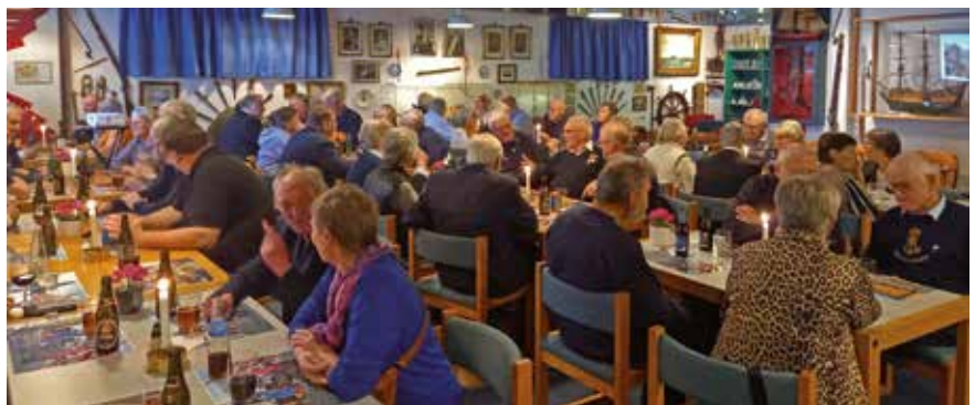
Medlemmer fra såvel Ebeltoft Marineforening som vores forening klar til foredraget.

Inden skydningen serveredes mod tilmelding og passende kuvertbetaling fra kl. 18 en middag bestående af ribbensteg med brune kartofler, rødkål og god sovs.